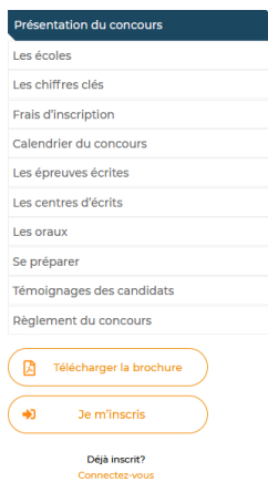
Nouveau menu « flottant »