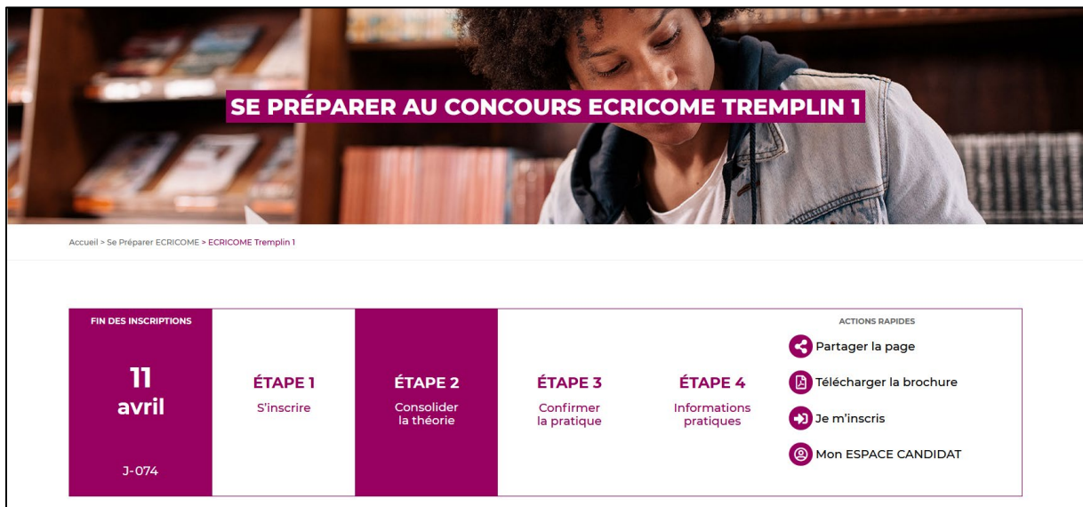
Nouvelle organisation des outils de préparation