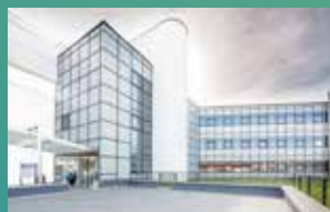
KEDGE BS BAYONNE*