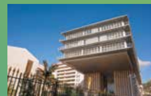
KEDGE BS TOULON