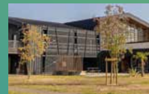
KEDGE BS MONT-DE-MARSAN*