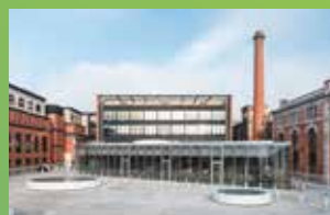
EM STRASBOURG BS STRASBOURG