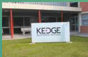
KEDGE BS AVIGNON*