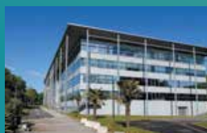
RENNES SB RENNES