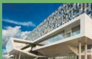
KEDGE BS BORDEAUX