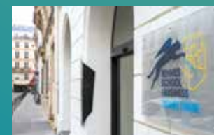
RENNES SB PARIS