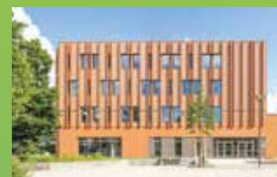
EM STRASBOURG BS MULHOUSE