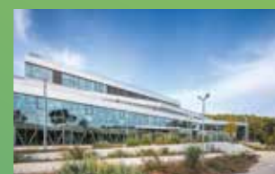
KEDGE BS MARSEILLE