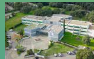
KEDGE BS BASTIA*