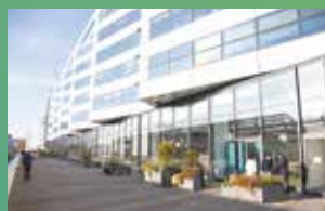
KEDGE BS PARIS